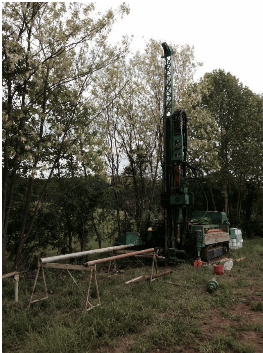
SONDAGGIO AV-PE-SO-02/18 – Postazione