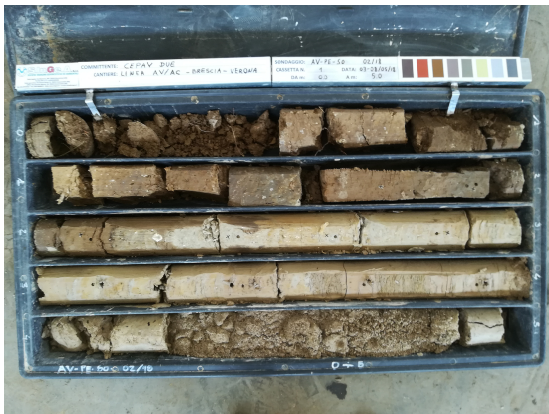
SONDAGGIO AV-PE-SO-02/18 – Cassa n.1 da 0.00 m a 5.00 m