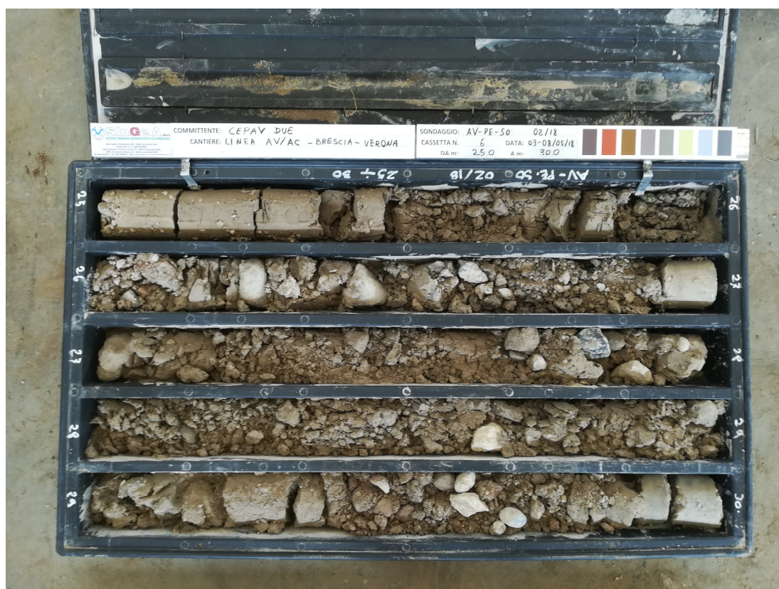
SONDAGGIO AV-PE-SO-02/18 – Cassa n.6 da 25.00 m a 30.00 m