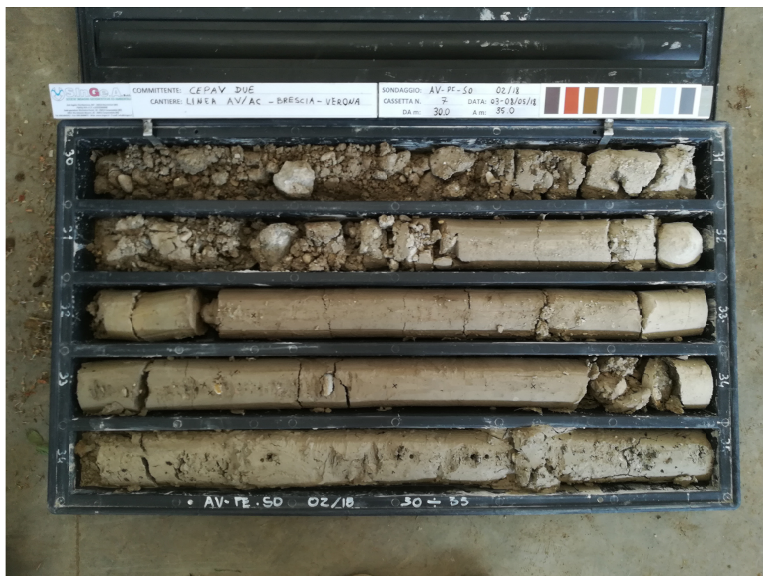
SONDAGGIO AV-PE-SO-02/18 – Cassa n.7 da 30.00 m a 35.00 m