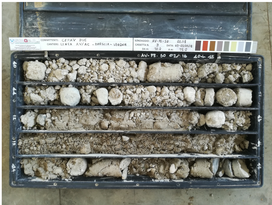
SONDAGGIO AV-PE-SO-02/18 – Cassa n.3 da 10.00 m a 15.00 m