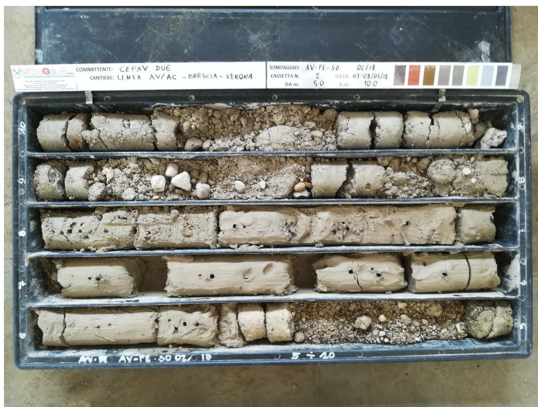
SONDAGGIO AV-PE-SO-02/18 – Cassa n.2 da 5.00 m a 10.00 m