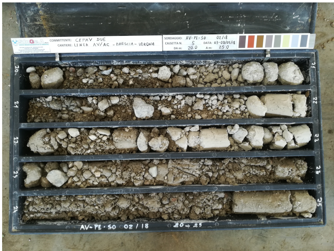
SONDAGGIO AV-PE-SO-02/18 – Cassa n.5 da 20.00 m a 25.00 m